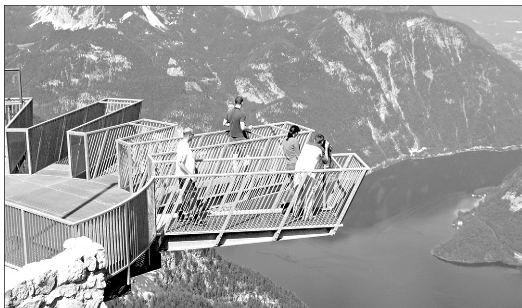
Die Aussichtsplattform hoch über Hallstatt ragt wie eine Hand in einen über 400 Meter tiefen Abgrund hinein.

Wie eine Hand ragt die Plattform nun hoch über Hallstatt in einen über 400 Meter tiefen Abgrund hi-